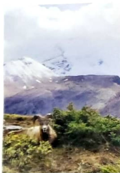
Ovce ilustrovaná na Wilcox Pass, AB

V národních parcích lze spát pouze v oficiálních kempech, my platili obvykle 15,70 $/noc. Kempy mívají podobné vybavení jako recreation sites, sprchy tedy nečekejte. Kapacita je omezena, a tak si hodně lidí zabere místo už ráno.